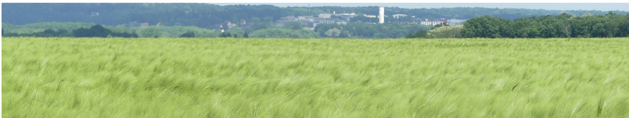
Vue 9 - Vue sur le site 2 depuis la route de la petite vallée. En arrière plan on distingue les structures urbaines d'Épernon.