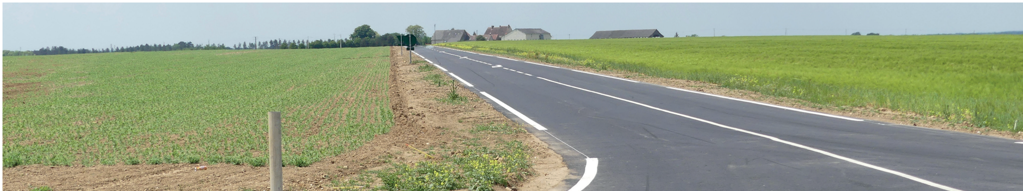
Vue 7 - Vue sur le site 2 depuis le croisement entre la route de la petite vallée et la D328. Au fond les bâtiments du corps de ferme et à droite l'emplacement futur du site 2 aujourd'hui en champs.