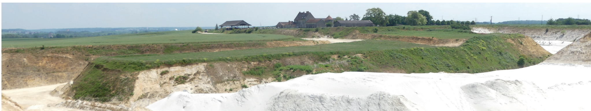
Vue 6 - Vue sur le site 1 depuis la butte. Au premier plan les fronts de sable, au second plan le chemin d'accès des carrières à l'arrière plan la ferme qui surplombe le site et au loin la plaine de Hanches