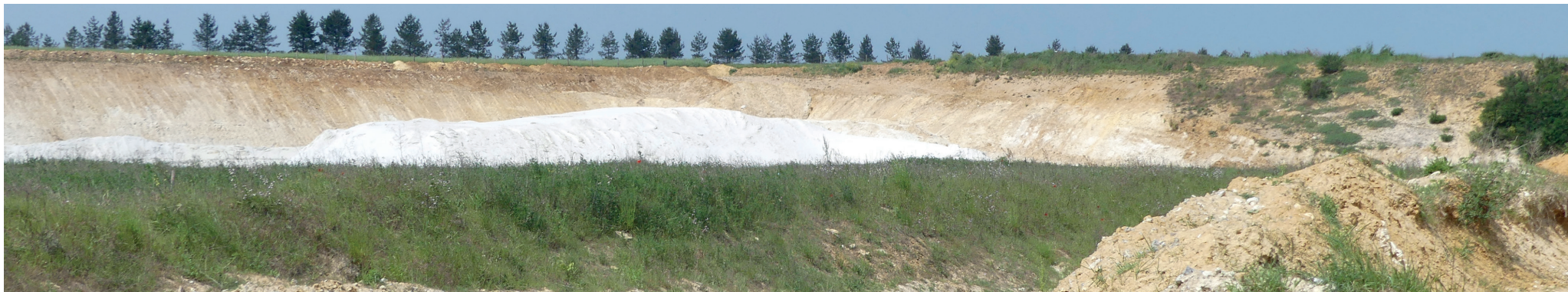
Vue 1 - Vue sur le site 1 depuis le cheminement qui mène au coeur de la carrière. On devine au fond la ligne de plantation de l'ancienne sablonnière voisine