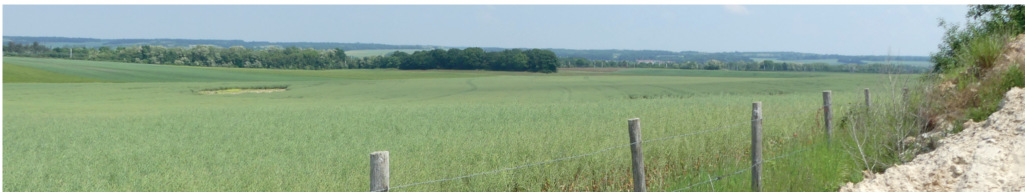
Vue 3 - Vue depuis le site 1 vers Hanches et la plaine céréalière. Un cordon boisé le long de la voie de chemin de fer cache en partie le site depuis Hanches