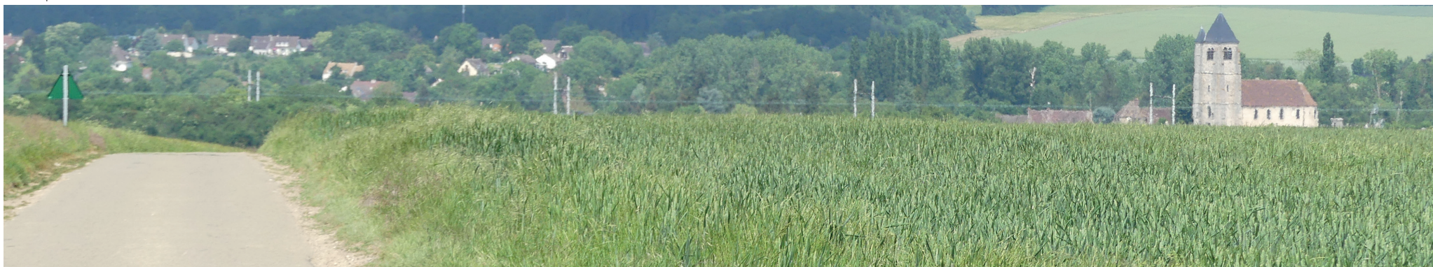
Vue 8 - Vue sur le site 2 depuis la D328.10 (route fermée qui va être déclassée prochainement) avec à droite l'emplacement futur du site 2 et au fond Hanches et son église.