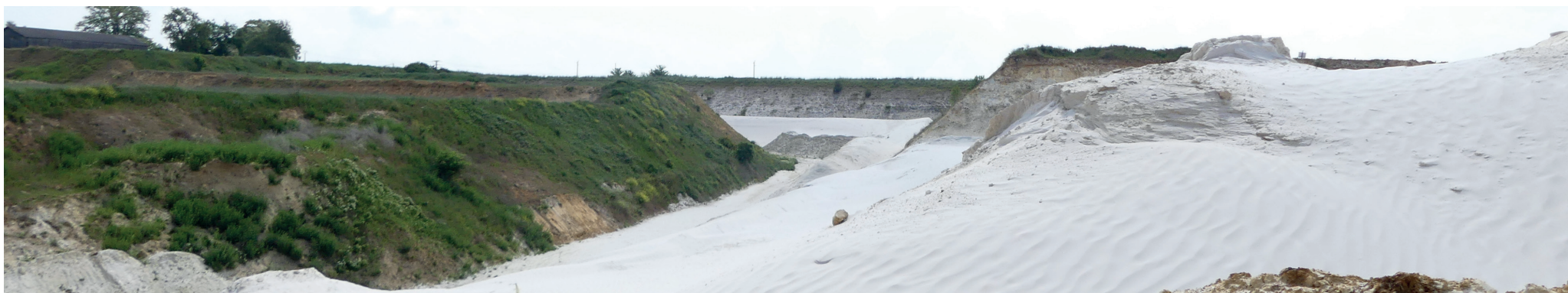
Vue 5 - Vue sur le site 1 depuis le coeur de la carrière. On devine au fond la ferme voisine