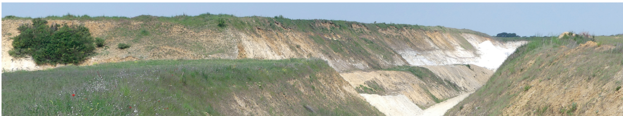
Vue 2 - Vue sur le site 1 depuis le cheminement qui mène au coeur de la carrière. L'ensemble de la carrière est en décaissé par rapport aux champs avoisinants.