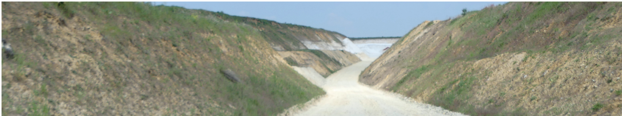
Vue 4 - Vue sur le site 1 depuis le cheminement qui mène au coeur de la carrière. Au coeur de la carrière le paysage environnant n'est pas visible